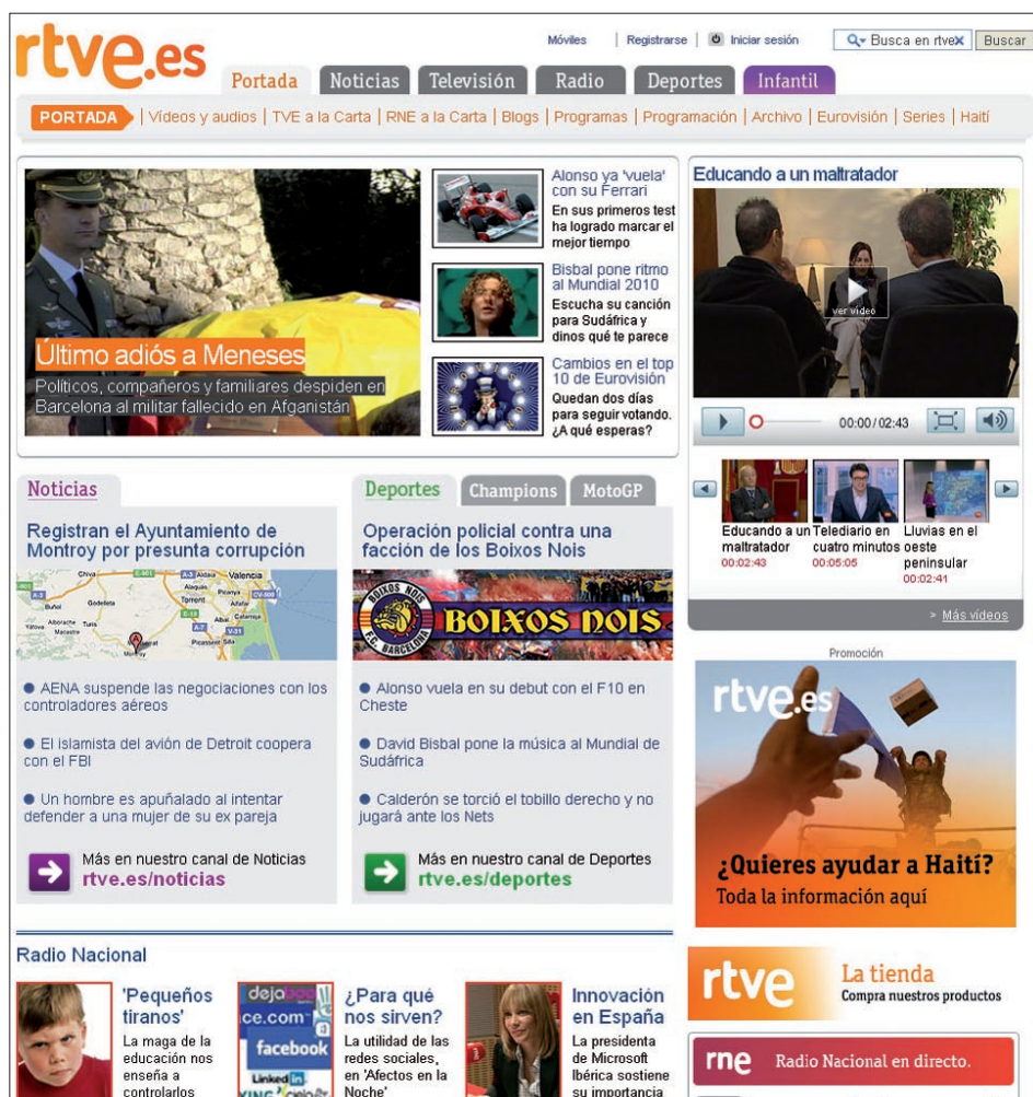
Figura 3. Rtve.es, http://www.rtve.es/

Los medios parecen haber sobrestimado el apetito de los usuarios por los contenidos infor-