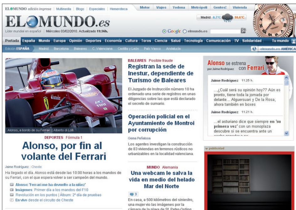
Figura 1. El mundo.es, http://www.elmundo.es

Este modo de actuación contrasta con las exigencias derivadas del consumo audiovisual. Los vídeos incluidos en los cybermedios presentan una duración media superior a los 3 minutos 12 , a los cuales hay que añadir el tiempo de descarga necesario, cada vez menor pero existente, además de la (habitualmente) obligatoria visualización de un spot publicitario que muchos medios añaden como antesala del vídeo.