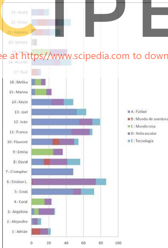
Gráfico 1: Relevancia de las categorías temáticas para el alumnado de Primaria del CEIP «La Paloma».

Esta forma de proceder en nuestro estudio otorgó dos dimensiones fundamentales al proceso etnográfico, sobre todo porque convirtió los registros foto-videográficos en un material valioso para acceder al «conocimiento del otro». Una, señalada por Ardèvol (2006), quien plantea que la relevancia de las auto-definiciones que posibilita la introducción de la cámara en el trabajo de campo reside en que la mejor descripción de una cultura la realiza el nativo –aproximación «emic–, porque se mueve dentro del universo cultural que queremos comprender, y porque estos datos son básicos para abordar las dudas, cuestiones e interpretaciones del investigador. Y otra, ya señalada, porque las narraciones audiovisuales generan un intercambio de significados no visibles ni accesibles mediante la observación directa de la realidad, de modo que se convirtieron en un material imprescindible para complementar las observaciones registradas en nuestros diarios de campo 2 . Estamos de acuerdo con Wolcott (2003) en que si toda etnografía nos exige observar el comportamiento en sus dimensiones culturales para descubrir pautas comunes, necesitamos no solo centrar la atención en las acciones, hay que profundizar en los significados que esas acciones tienen para los actores sociales. Nuestra obser-