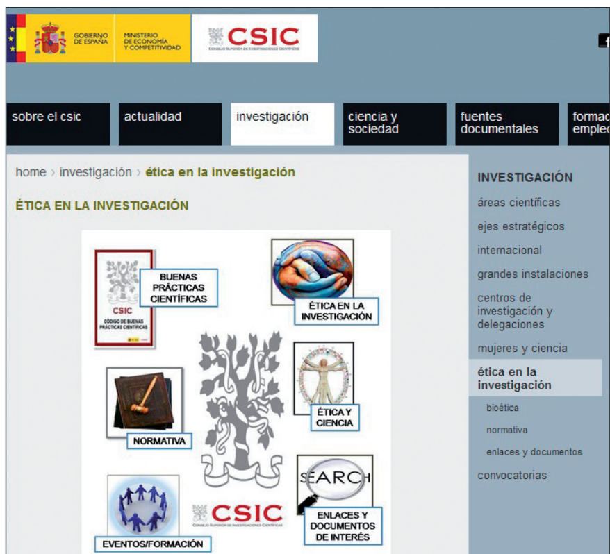
Ética en la investigación en la web del CSIC

a) El grado de participación en el estudio dependerá de la presencia simultánea de estas condiciones: la intervención