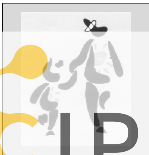
Programa de Escuela y Salud

ra que la Educación para la Salud sea un objetivo común de toda la comunidad educativa. A su vez, apoyar al profesorado para que la educación para la salud se desarrolle de forma transversal en el currículo de las distintas áreas y etapas educativas.