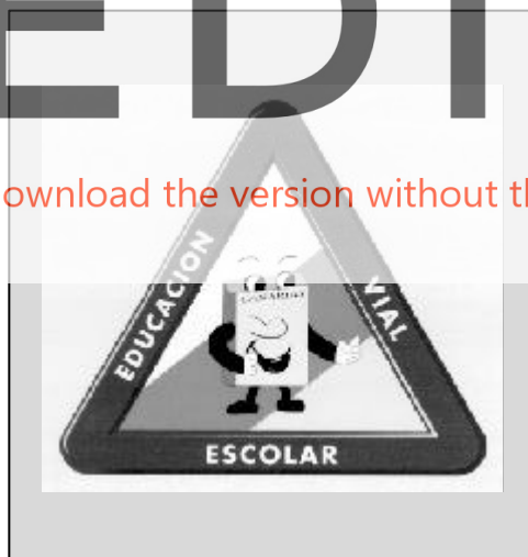
Programa de Educación Vial

Este Programa surge por la insistencia en la sociedad y en los centros educativos para mejorar, en calidad y en cantidad, la formación y la educación del alumnado, en las relaciones entre los usuarios de las vías, la calidad medioambiental y, consiguientemente, la seguridad vial personal y colectiva.