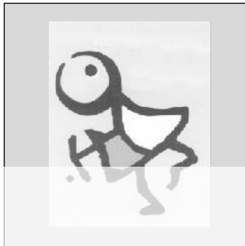
Programa de Educación para la Igualdad

Por otro lado, propugna desarrollar acciones «de choque» que corrijan la segregación