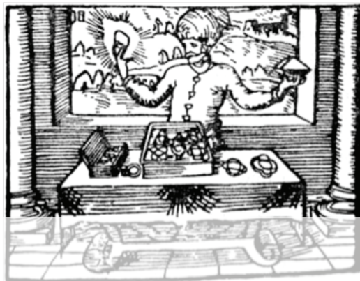
Un mercader en el Siglo de Oro 1