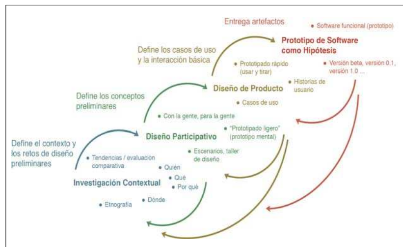
Figura 1. Proceso de diseño basado en la investigación.

Los resultados del diseño participativo se analizan en el estudio de diseño por los investigadores y se utilizan para crear los primeros prototipos que luego se prueban y validan de nuevo en las sesiones de diseño participativo. Al mantener una distancia de las partes interesadas, en la fase de diseño del producto, los investigadores en diseño tienen la oportunidad de analizar los resultados del diseño participativo, clasificarlos, utilizar el lenguaje de diseño específico relaciona-