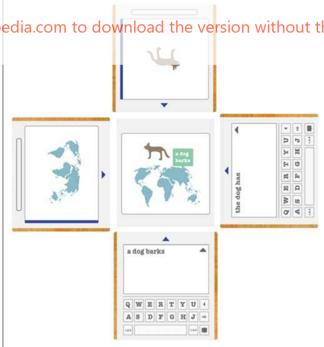
Figura 3: Visualización del prototipo Square1 en Noviembre de 2012 (por Anna Keune).

El prototipo Square1 incluye tres dispositivos: uno para la escritura, uno para el dibujo y un dispositivo de ordenador central para la búsqueda y composición de la presentación (figura 3). Con estos dispositivos, un grupo de cuatro niños en edad escolar puede hacer búsquedas en Internet con la pieza central, escribir notas con los dispositivos de escritura y hacer dibujos con los dispositivos de dibujo. Se espera que el trabajo con el dispositivo central genere negociación sobre la