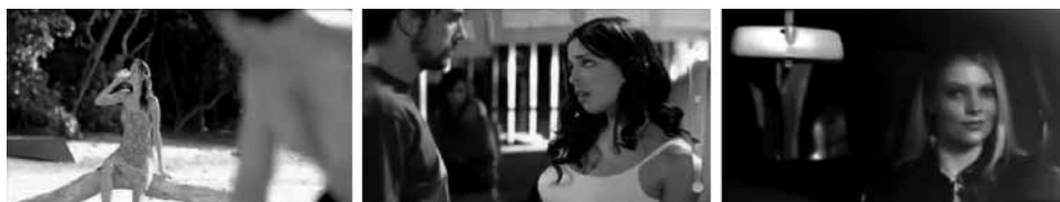
Figuras 11, 12 y 13: fotogramas de spots Coca-Cola Diet, Brahma y Mazda.

De otro lado, tenemos la mujer que manipula, de inicio a fin, a los hombres para conseguir lo que desea. Así en el spot de Mazda (figura 13), observamos a una bella joven, pretendida por tres varones: cada uno de estos muestra las llaves de sus autos. Dos de ellos (agraciados y con dinero) poseen autos deportivos y el tercero (fornido, menos agraciado y vestido de forma sencilla) tiene una camioneta. La joven se va con el chico de la camioneta para sorpresa de todos. Al final se abre la toma y el elegido está subiendo un pesado mueble en la tolva de su camioneta, que era el objetivo de la fémina y la razón principal de haber rechazado a los otros dos varones.