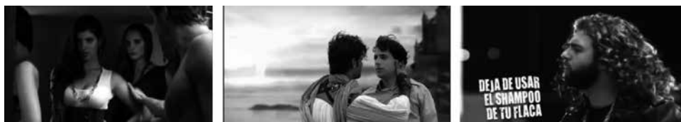
Figuras 31, 32 y 33: fotogramas de spots John Holden, Frio Rico y Geomen.

No obstante, esto no siempre ocurre. Muchas veces al ser un patrón “aprobado” son pocos los operadores y público en general que está sensibilizado y consideran que la marca puede incurrir en una ofensa hacia determinados grupos. Un ejemplo de ello es la marca John Holden. Desde hace varios años trabaja la idea de la “conquista de la mujer” a través de sus prendas. Esta idea no es nueva, pero algunas de sus ejecuciones exhiben a la mujer como mero objeto, tal como sucede en el spot “Closet” (figura 31). El protagonista abre su guardarropa lleno de diversas mujeres: escoge una, la saca del closet y se la prueba. En contraplano se observa que se trata de la ropa con la cual se asume conquistará a una chica de similares rasgos.