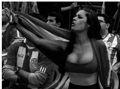
Figuras 5 y 6: imágenes de Larissa Riquelme y del programa “Risas de América”.

Pensemos que estas situaciones se trasladan a espacios cotidianos y diversos, como por ejemplo el fútbol, donde si bien hay muchas mujeres hinchas de este deporte e incluso comentaristas, se observa que la mayoría de programas tienen secciones donde los camarógrafos, con supuesta anuencia de los directores y conductores del programa, muestran hinchas voluptuosas, de “buen cuerpo” (figura 5). Como menciona Conde (2008: 124), dentro de ese entorno “las mujeres están para ser miradas”. La misma lógica se puede apreciar en los programas cómicos de la televisión peruana (figura 6), donde la participación de las mujeres se centra específicamente en su aparición en prendas diminutas y en hacer énfasis que tienen una vida sexual muy activa; con lo cual se contribuye al estigma y la discriminación.