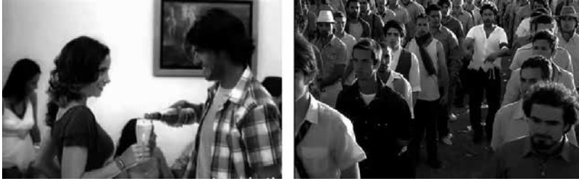
Figuras 22 y 23: fotogramas de spots Quara y Quilmes.

(figura 23) por su lado, con una producción fastuosa y diálogos muy bien escogidos, revela las luchas por el poder en la pareja. Si bien los insights activadores son muy reconocibles, el final solo lleva a aceptar de ambos lados todas aquellas cosas que son motivos de las disputas; afianzando la idea de que no hay posibilidad de cambio, solo de aceptación.