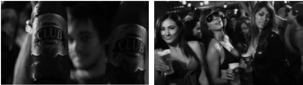
Figuras 9 y 10: fotogramas de spot Cerveza Club.

El nexa para ingresar a este mundo será el producto. Cerveza Club utiliza estos códigos (figuras 9 y 10): los varones muestran la cerveza que actúa como “pasaporte”; lo cual está integrado como parte de la identidad de la marca y del eslogan (“Tu pasaporte a la diversión”). La cerveza permite ingresar a un mundo de fiesta, bebida, concursos, bailes tipo pool dance, camisetas mojadas y muchas chicas guapas (casi siempre sin parejas) bailando en prendas ajustadas, configurándose así la “fantasía” de todo hombre.