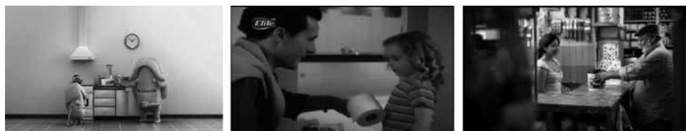
Figuras 38, 39 y 40: fotogramas de spots Lucchetti, Elite y Fast.

En Argentina la marca de pastas Lucchetti lanzó la campaña “Mamá Lucchetti” (figura 38). En la animación aparece una madre interactuando con uno de sus hijos de manera tal que rompe con la efigie idealizada de “ser buena madre”, como en aquellos spots donde siempre aparece feliz, bella y arreglada. Sedal (Youtube, 2008l) lanza el siguiente mensaje: “Sentirte orgullosa despeina y eso te queda muy bien”, mostrando una historia donde una madre soltera no tiene temor de decirlo. Elite (figura 39) propone a un padre de familia amoroso, que acompaña a su hija al baño como quizá muchos padres jóvenes estén haciendo hoy en día.