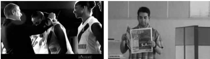
Figuras 24 y 25: fotogramas de spots Unique y Perú.21.

j) ¿El éxito solo es masculino? : este es, probablemente, uno de los pocos puntos donde la certeza del postulado que se aplica en televisión no nos es tan clara. La mujer peruana ganadora, con empuje y coraje no es un personaje “desconocido”. La universidad César Vallejo trabajó una de sus campañas mostrando a una joven que salía muy temprano a estudiar, confiada en vencer todas las adversidades a las que se enfrentaría en su vida universitaria: horarios madrugadores, profesores difíciles, prácticas, entre otras (Youtube, 2009b). Una marca más conocida como Unique (figura 24), ensalza y se identifica con las características del equipo nacional juvenil de voleibol, buscando transmitir este mensaje de “mujer ganadora”.