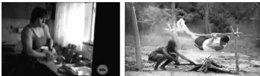
Figuras 29 y 30: fotogramas de spots Magistral y El Comercio.

Spots como el de detergente Magistral (figura 29), que muestra a una madre de familia con unos brazos musculosos por lavar platos (su entrenador le insiste en que lave y friegue platos para mantenerlos, es decir, perennizar su lugar en la cocina); o el aviso tailandés que ofrece un atún bajo en grasa (Youtube, 2009e), donde la protagonista contiene la respiración para ostentar un abdomen plano frente a sus compañeros de trabajo (varones), pueden llevarnos a pensar en los códigos que estamos enviando en la formación de la feminidad y su aceptación dentro de la sociedad.