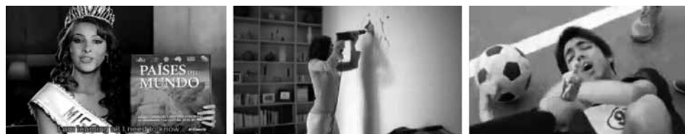
Figuras 14, 15 y 16: fotogramas de spots El Comercio, Seguros Mercator y Cristal.

c) La mujer tonta: el spot “Miss Universo” del diario El Comercio (figura 14) exhibe a una reina de belleza con el típico tono de “chica boba”. Sin embargo, este canon no se ha quedado sólo en las rubias ni en las estadounidenses; sino que ha pasado como una categoría “común” al resto de las mujeres. De modo tal que su éxito, especialmente en el campo laboral, muchas veces es cuestionado y asociado con algún tipo de favor de índole sexual. En muchos contextos, los comentarios femeninos suelen ser subvalorados y aún continua una lucha por el reconocimiento e igualdad de espacios, así como cuotas de participación significativos en grupos de poder como en los partidos políticos.