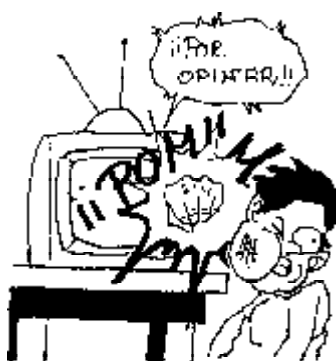
47. Derecho a interrelacionarse con la tele.