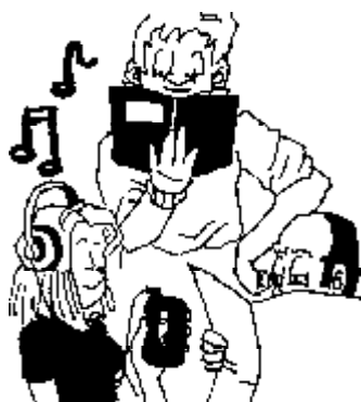
45. Derecho a vivir sin televisor.