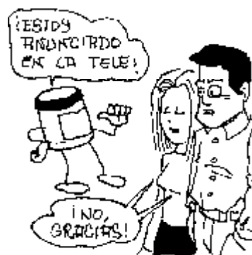
48. Derecho a no comprar productos «anunciados» por la tele.