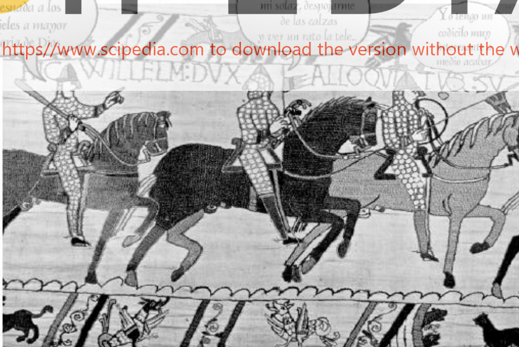
© Enrique Martínez-Saizosa, 2002. Para Comunicar

Register for free at https://www.scipedia.com to download the version without the watermark