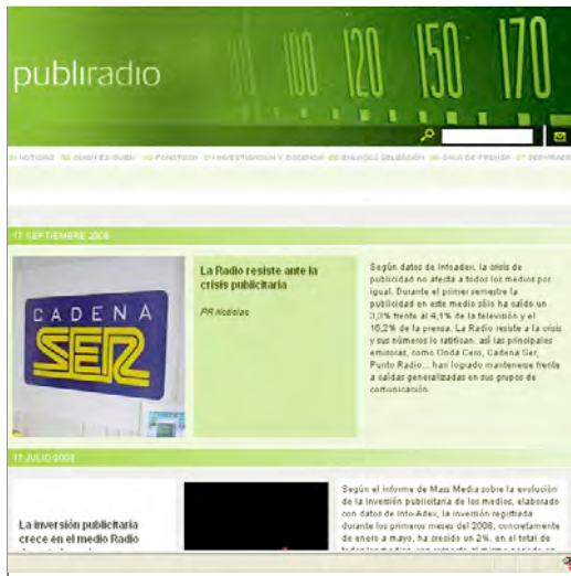
Publiradio.net ( www.publiradio.net ) (24-09-08).

Las diferentes iniciativas analizadas en esta aportación ponen de relieve el crecimiento que está experimentando la educación en comunicación, especialmente aquella que se sirve de las posibilidades que ofrece Internet. Esta circunstancia ha ayudado a que algunas de las modalidades educativas de la radio hayan entrado en una etapa de clara expansión, como es el caso de las radios escolares y universitarias, las cuales no han dudado en aprovechar la Red como una