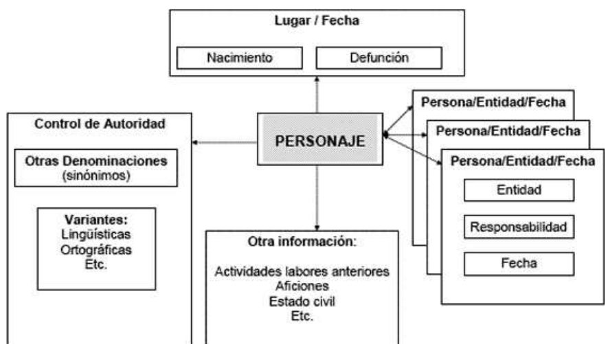
Figura 2. Control onomástico de personaje en TV

Establecemos 5 clases primarias que representan los conceptos fundamentales para la descripción y recuperación de personajes. Los personajes constituyen la clase fundamental y son descritos en torno a características (slots) representados como rectángulos de borde azul para los atributos cuyo valor es tan sólo texto, como el nombre, los datos de control de autoridad (que incluirán variaciones ortográficas y diferentes versiones), y otros datos como las aficiones, su estado civil, etc. Respecto al control de autoridad, hay que decir que cada instancia que representa un personaje