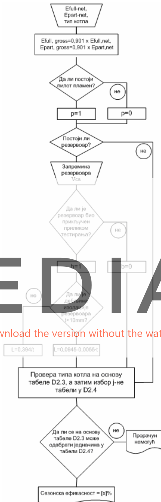
Слика 1: Приказ прорачуна Сезонске ефикасности 1

Котлови покривени једначинама 101 (1) и 102 (3) служе за обезбеђење грејања, а не и потрошне топле воде у општем случају (енг. regular), док су котлови покривени једначинама 105 (2) и 106 (4) тзв. комби котлови, тј. обезбеђују топлу воду за грејање као и потрошну топлу воду и имају интерни резервоар од најмање 15 а највише 70 литара, а уколико је резервоар већи од 70 литара тада грејни круг не сме да се напаја из овог резервоара, а ако се напаја не потпада у ову класу котлова, већ се сезонска ефикасност рачуна по другачијој једначини.