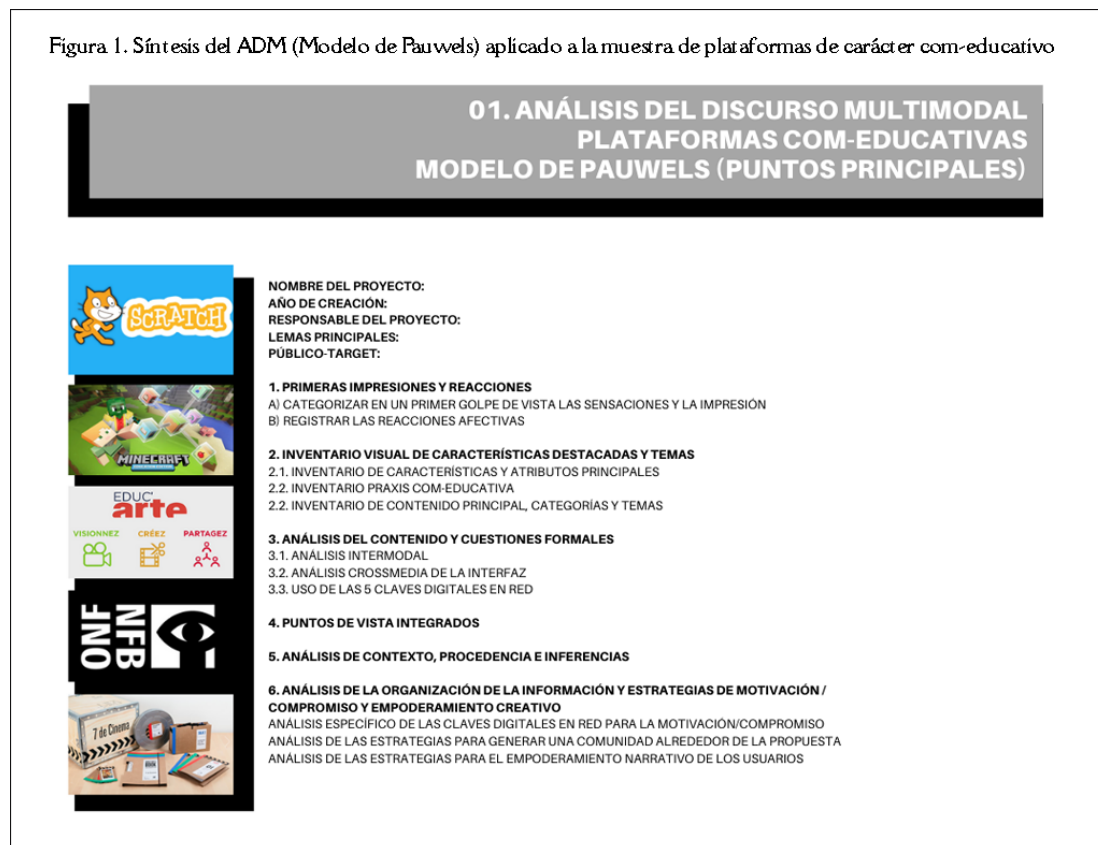
Figura 1. Síntesis del ADM (Modelo de Pauwels) aplicado a la muestra de plataformas de carácter com-educativo

Con los resultados obtenidos tras el análisis, se confecciona el guion para el cuestionario y se prepara una codificación preliminar para la segunda técnica empleada: la entrevista a observadores privilegiados, como «conocedores expertos del fenómeno, con una visión directa y profunda del mismo que los sitúa en una posición de observación privilegiada» (Corbetta, 2007: 358). Nos interesa ampliar y profundizar en la perspectiva que aborda la educación desde la comunicación a partir de su conocimiento experto (y creativo), poniendo el foco sobre el empoderamiento. De nuevo, la muestra es seleccionada bajo el marco de la decisión razonada. Se aplican criterios racionales, evitando la selección casual que puede suponer un distanciamiento respecto a las características de la población. La condición para la selección de los sujetos de la muestra ha sido su perfil profesional como narrador experto en el ámbito de los formatos digitales, en una clasificación fundada en criterios de impacto e influencia (Figura 2).