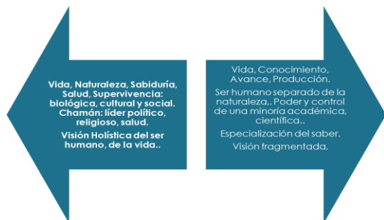
Grafico 2. Coexistencia Paradigmática en la Negación: Paradigmas Sociomédico y Biomédico

La opinión general coincide en el carácter alternativo de los dos sistemas: o se usa medicina científica en centros de salud pública o privada, o se usan servicios de sistema sociomédico. Gráfico 2.