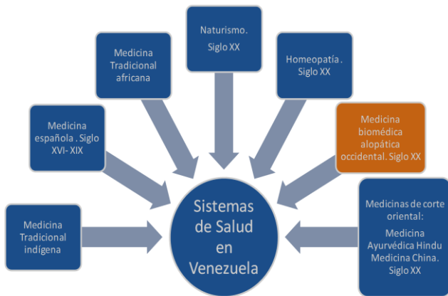
Grafico 1. Sistemas de Salud en Venezuela.

Cuando surge el movimiento de Independencia, la medicina indígena y la española entran en contacto con la medicina africana traída por los esclavos que llegaron en grandes contingentes de África. Las tres formas de hacer medicina combinadas dieron origen a lo que se llama Medicina Popular Venezolana : Esta Medicina Popular se encuentra en zonas urbanas. La medicina tradicional más indígena se encuentra en las zonas rurales. A partir del siglo XIX- XX: encontramos en nuestro país la Medicina científica, los grupos culturales inmigrantes traían sus prácticas médicas: así llegan a Venezuela medicina ayurvédica, china, naturista y homeopática.