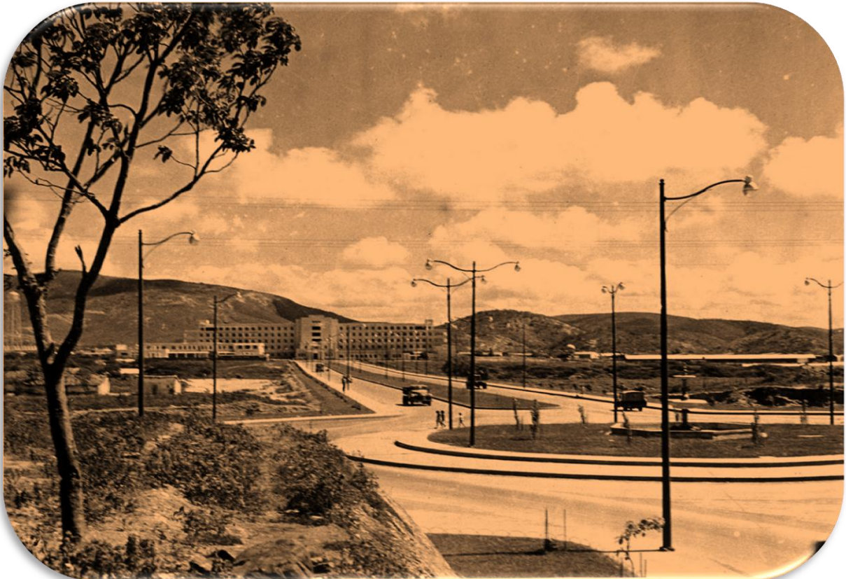
Imagen 4. Recién inaugurado Hospital Antonio María Pineda, al Norte de la Avenida Vargas, año 1954. Barquisimeto, estado Lara, Venezuela.