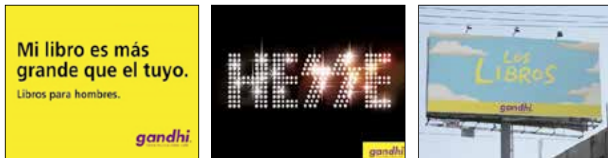
Figura 2: Publicidad gráfica de librería Gandhi.

Esta librería ha utilizado un recurso creativo y divertido para atraer a diferentes grupos hacia la lectura tradicional 13 , empleando afiches, carteles y publicidad BTL (figura 2) con frases ocurrentes tales como “Mi libro es más grande que el tuyo. Libros para hombres”, “Leer, guey, aumenta, guey, tu vocabulario, guey”, “Enamorados se suicidan por falta de comunicación [Ya leíste Romeo y Julieta]”, entre otros: