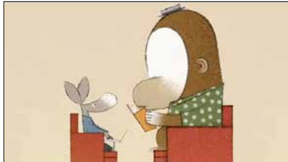
Figura 1: Fotograma del video “It’s a book”.