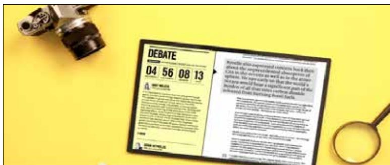
Figura 4: Fotogramas del video “El futuro del libro IDEO”.

IDEO cree que el constante crecimiento del contexto digital puede mejorar nuestra noción de los libros. Con base en este enunciado proponen tres conceptos de experiencia lectora desarrollados por ellos en los que explican de qué forma se puede dar esta integración entre contexto digital y noción de libro.