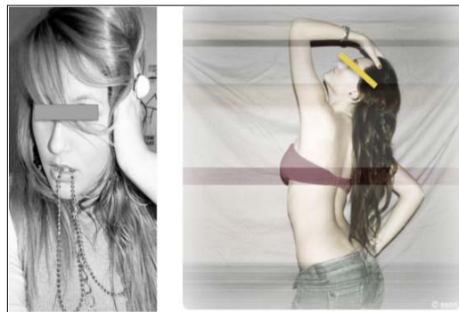
Imagen 4: Tacto femenino.

En algún caso, las fotos de besos con amigas aparecen después de empezar una relación heterosexual y, en otros, parece haber un cuestionamiento de un modelo de masculinidad que se percibe como agresivo. Los comentarios realizados por las amigas, además de las fotos y los textos, refuerzan también esta idea cuando definen a este tipo de chicos como «monstruos» o comentan que ya no se lleva enamorarse «del