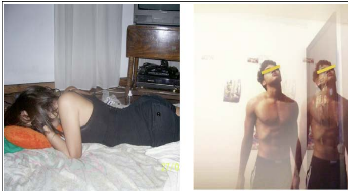
Imagen 3: Retirada permitida.

Aunque los sujetos acostumbran a mirar a la cámara cuando se fotografían (58% en el caso de las chicas, 45% en el caso de los chicos), también es bastante frecuente que unas y otros miren al vacío (14% y 16% respectivamente). Sin embargo, ellas siguen el patrón conceptualizado por Goffman (1979) porque las vemos presentes físicamente pero ausentes mentalmente y ellos el modelo definido por Dyer (1982) ya que muestran determinación, fuerza o solemnidad mientras miran hacia arriba, fijamente o más allá del espectador.