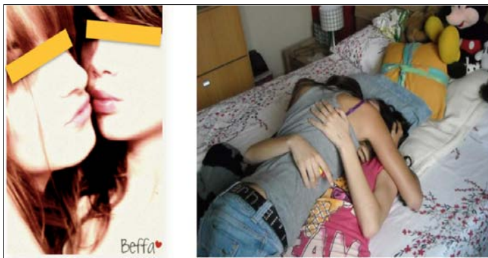
Imagen 5: Pose lésbica.