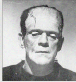
Frankenstein 116 películas