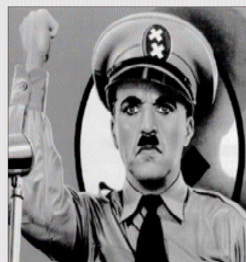
Hitler 76 películas