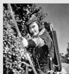
Robin Hood 62 películas