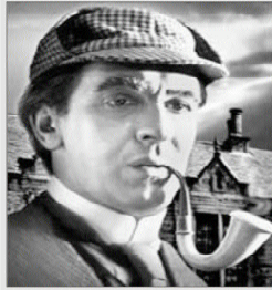
Sherlock Holmes 207 películas