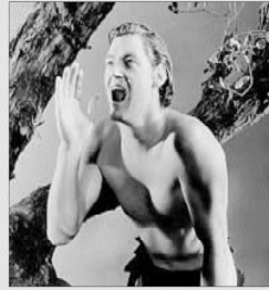
Tarzán 98 películas