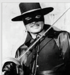
El Zorro 70 películas