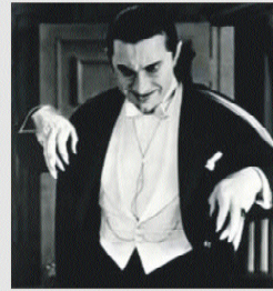
Drácula 164 películas