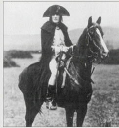
Napoleón 196 películas