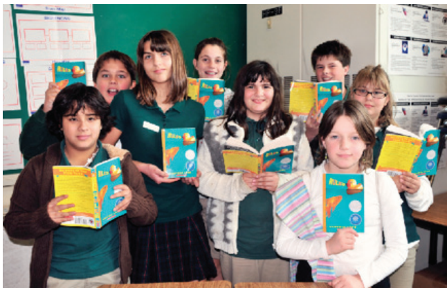
La discusión en grupo estimula la participación de los alumnos

La interrelación de las cuatro dimensiones que articulan los resultados de la investigación puede constituir una base adecuada para construir una práctica exitosa de animación a la lectura, que fomenta el gusto lector por las razones siguientes: