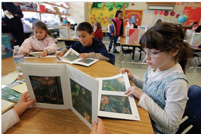
- "A mí los libros me gustan más sin imágenes, para imaginármelo"

discutir sobre las obras con otras personas. Así lo han expresado algunos alumnos al responder qué es lo que más les gusta del club 1 : "Los comentarios, porque hablamos de los libros" (O2,11,C); "Las reuniones, porque me parecen interesantes" (O9,11,C). Los casos de lectura dialógica son muy numerosos y están presentes en las tres fases principales de las sesiones.