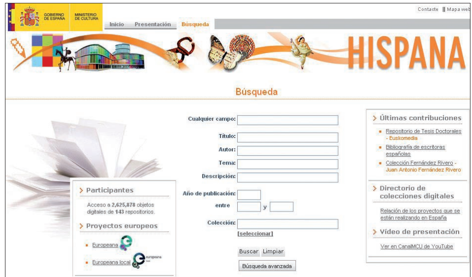
Figura 1. Hispana. Directorio y recolector de recursos digitales, http://roai.mcu.es

Frente a la fragmentación de proyectos institucionales, los archivos temáticos como arXiv o PubMed Central pueden ocupar un lugar destacado en la comunicación internacional para una disciplina. Los investigadores están interesados en suscribirse a las alertas de nuevos trabajos