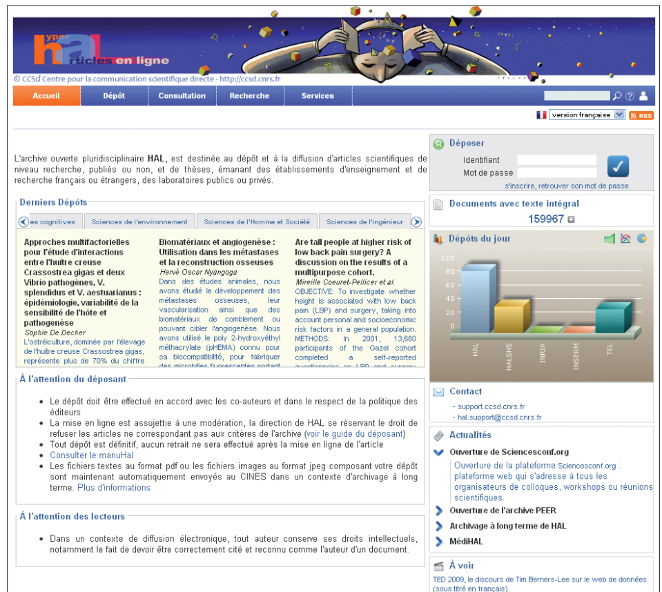
Figura 2. HAL, http://hal.archives-ouvertes.fr

“En España, el principal ejemplo de funcionamiento centralizado es Recercat”