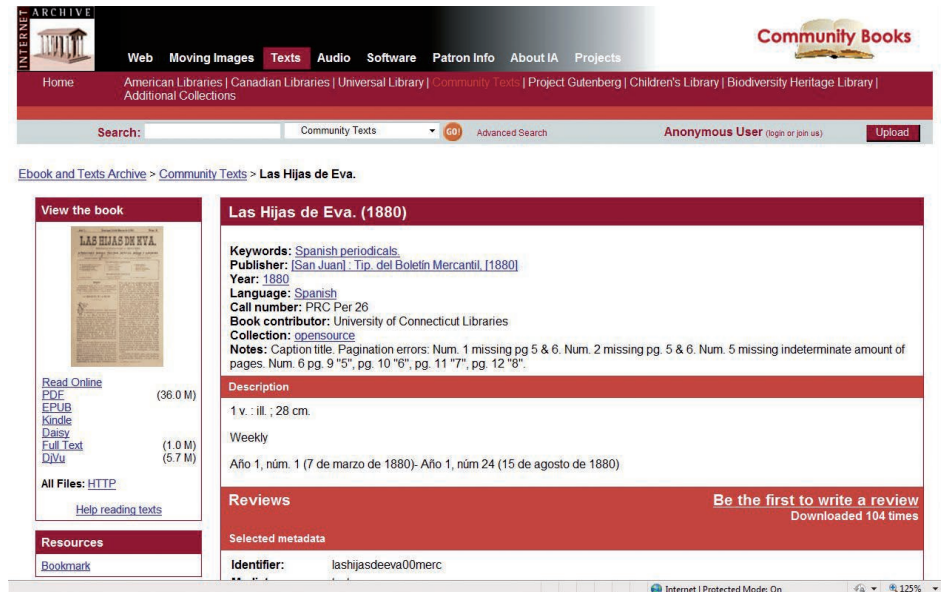
Figura 4. Acceso a la Colección digital de revistas femeninas desde Internet Archive. Ejemplo: Las hijas de Eva (1880), http://www.archive.org/details/lashijasdeeva00merc

posibles lectores muy alejados geográficamente. Desde que se puso en marcha el proyecto la mayor parte de los accesos en línea han llegado precisamente desde España.