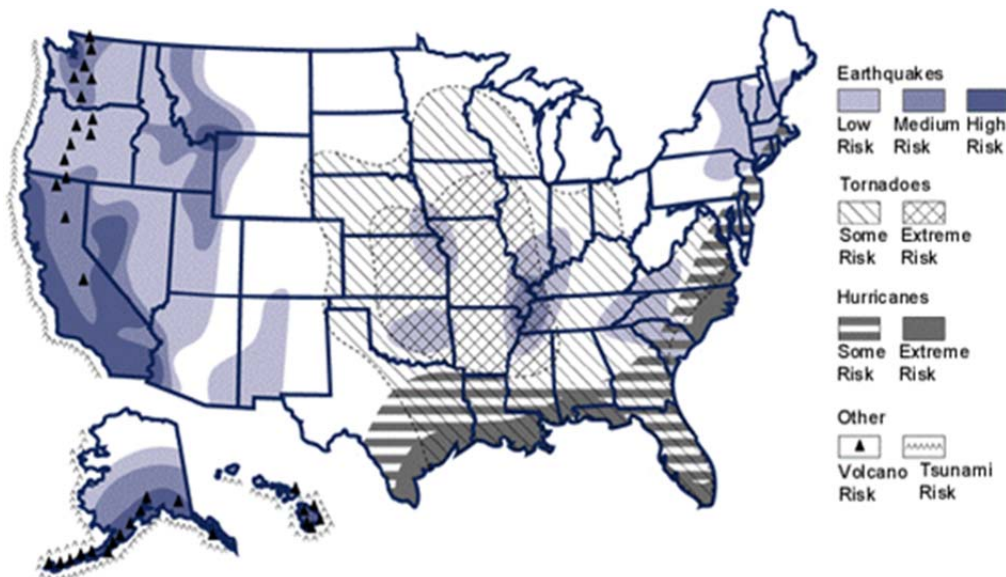
Figura 1: Mapa mostrando las regiones de los Estados Unidos susceptibles a varios tipos de peligros (adaptado del Comité de Infraestructura Crítica de la Sociedad Americana de Ingenieros Civiles, 2011).

Los peligros naturales que pueden afectar las carreteras y puentes incluyen inundaciones costeras, terremotos, inundaciones, olas de calor, huracanes, deslizamientos de tierra, tornados, tsunamis, volcanes, incendios forestales y tormentas de invierno. Los eventos inducidos por el ser humano incluyen incendios, riesgos tecnológicos y el terrorismo. Entre los riesgos que pudieran afectar los puentes se encuentran los incendios, choques, sobrecargas, explosiones, entre otros (Duwadi, 2010). La Figura 1 muestra las regiones de los Estados Unidos susceptibles a distintos peligros.