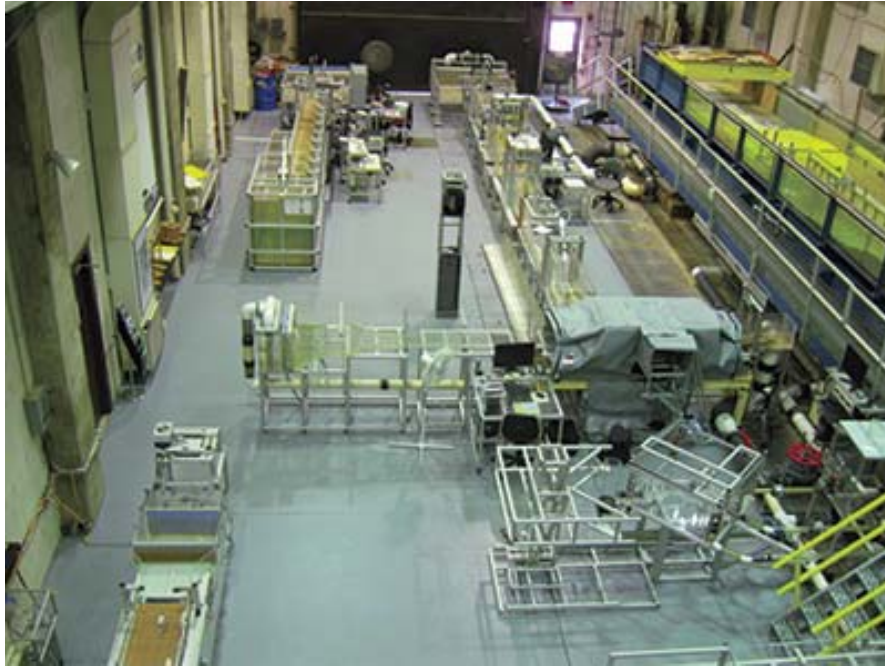
Figura 3: Vista de varios estanques de prueba del Laboratorio de Hidráulica J. Sterling Jones localizado en el Centro de Investigación Carreteras Turner-Fairbank en McLean, Virginia.

pilastras de un puente y de un puente con loza sumergida. El laboratorio consiste de una planta física y de un centro de modelación numérico. La planta física ofrece un estanque de inclinación movable, un estanque para conducir estudios de equilibrio de fuerzas, un estanque de oleaje, una estación para conducir experimentos con imágenes velocimétricas y una instalación para pruebas de alcantarillas. El centro de modelación numérica incluye sistemas para realizar simulaciones basadas en cálculos de la dinámica de fluidos (FHWA, 2007).