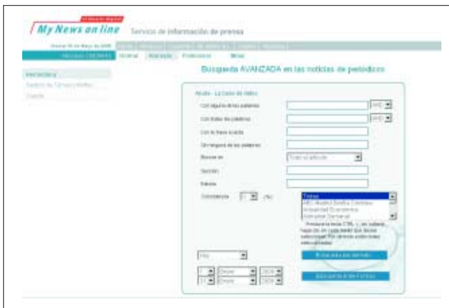
Opción de búsqueda avanzada de My news .

La posibilidad de localizar informaciones retrospectivas de los medios mediante búsquedas por palabra clave es uno de los servicios de la prensa digital que tienen mayor interés para el usuario profesional, y en particular para el documentalista. La mayoría de grandes medios han mejorado notablemente estas prestaciones en comparación con las que ofrecían hace unos años e incluyen en algunos casos dos modalidades de búsqueda: sencilla y avanzada.