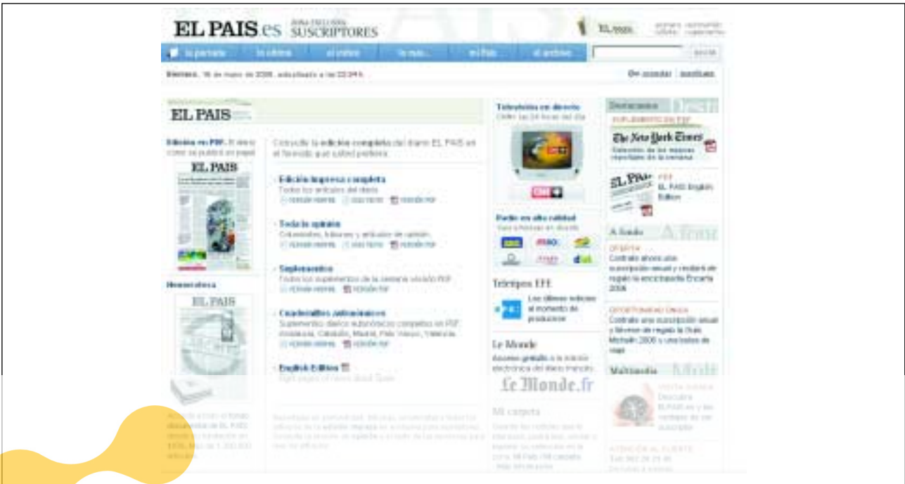
Oferta de servicios de pago de El país.