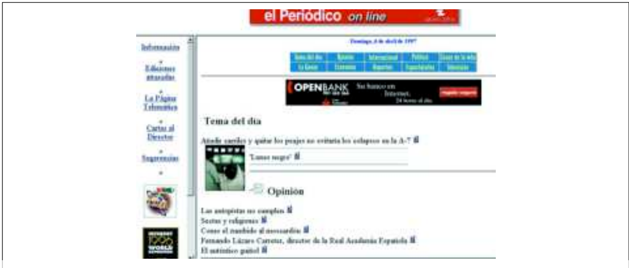
Evolución de un diario digital: portadas de El periódico de Catalunya de 1997 y 2006.

mente el panorama de la prensa digital en nuestro país.