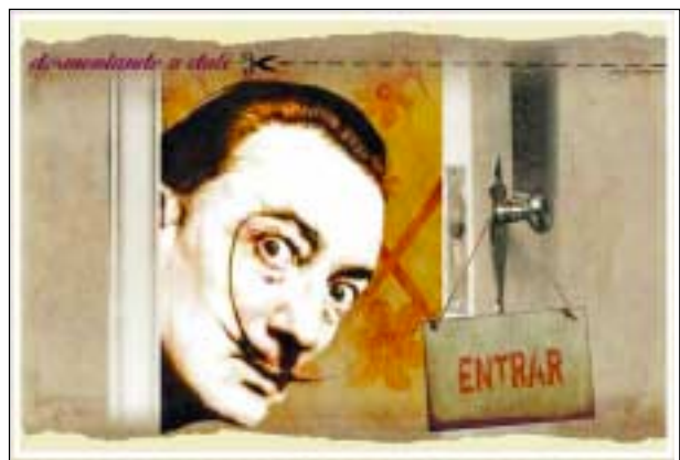
Un conocido ejemplo de documento multimedia: "Desmontando a Dalí" de La Vanguardia.

Register for free at https://www.scipedia.com to download the version without the watermark