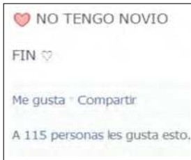
Imagen 1. Captura de muro de usuaria adolescente, sectores populares.

relación con», «¿quién quiere ser mi novio?»; «todos en pareja y yo sola». Nótese la popularidad (115 MG) de la imagen 1 en la que una adolescente actualiza su estado.