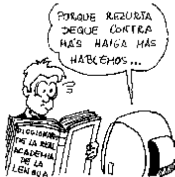
39. Derecho a mantener, respetar y mejorar nuestro idioma a pesar de los desmanes lingüísticos de los que hablan en la tele.