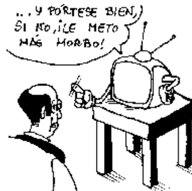
40. Derecho a defenderse del defensor del telespectador.