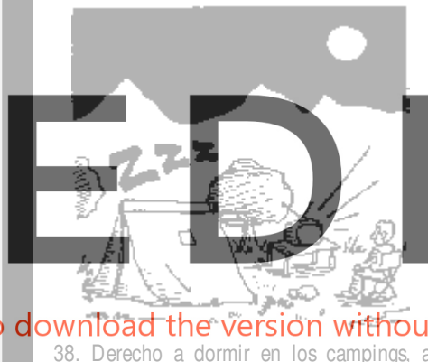
38. Derecho a dormir en los campings, a pesar de que la tele emita toda la noche.