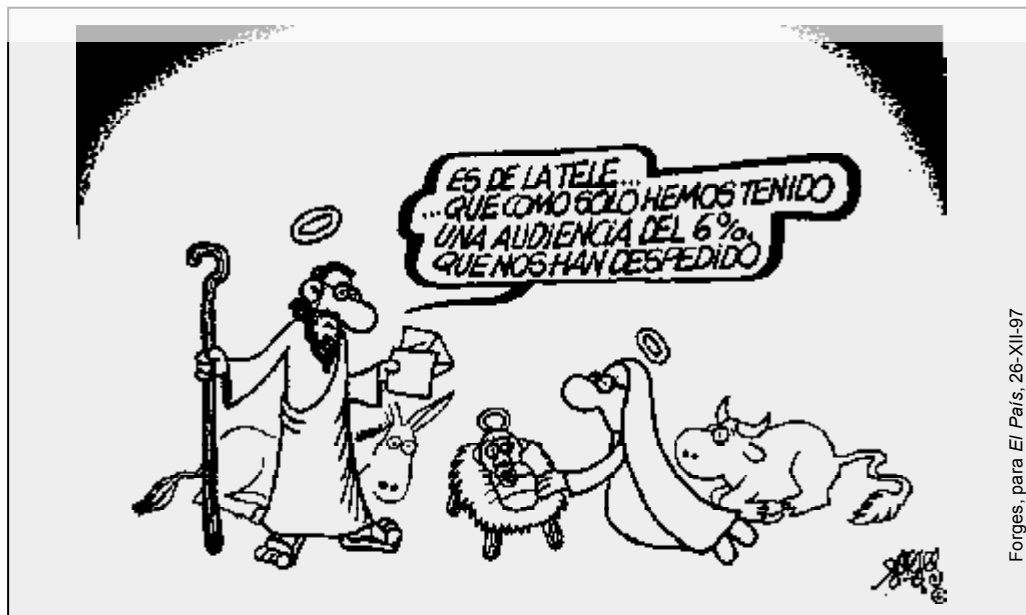
Forges, para El País, 26-XII-97

Register for free at https://www.scipedia.com to download the version without the watermark