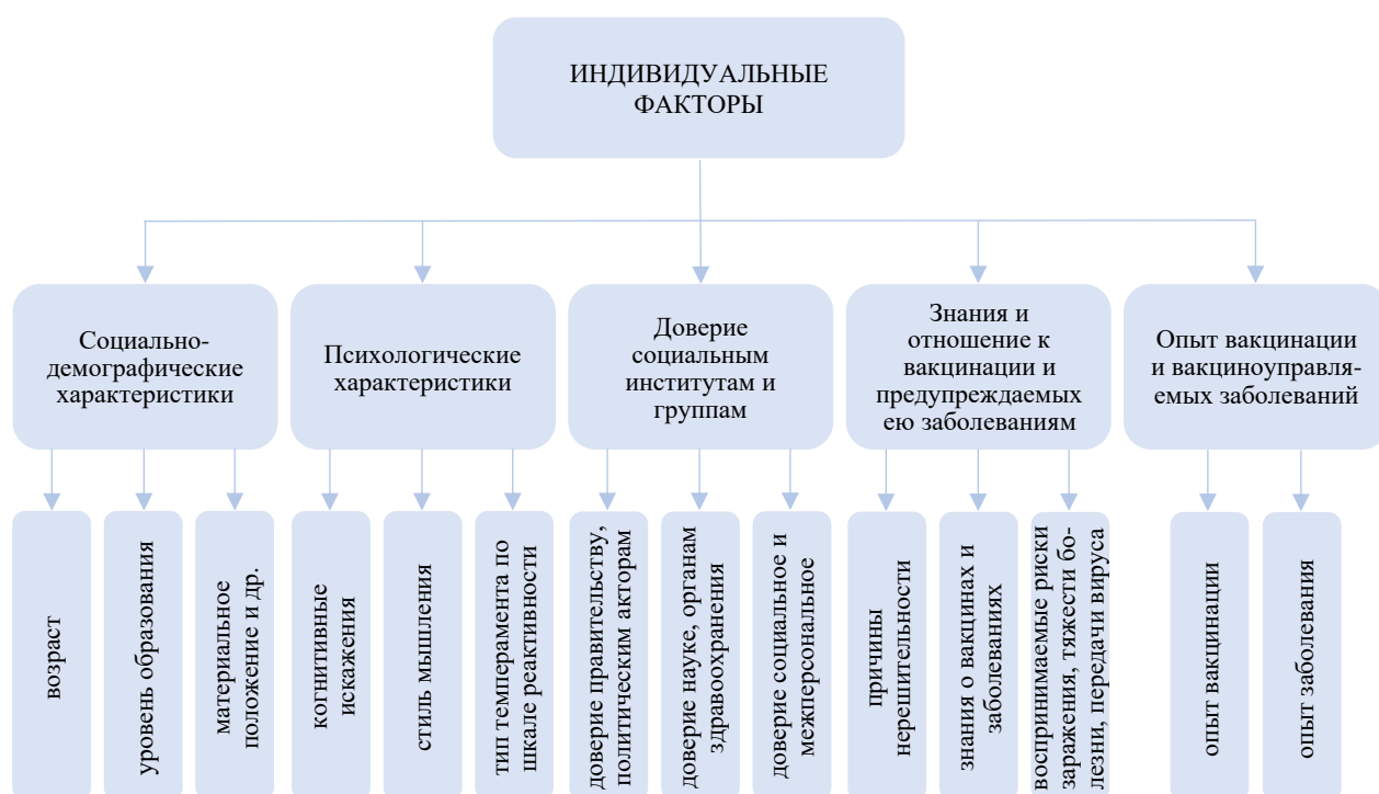
Рисунок 2 – Индивидуальные факторы поведения населения в отношении вакцинации

Результаты исследований показывают, что стратегии и тактики поведения в отношении вакцинации во многом зависят от социально-демографических и психологических характеристик индивидов, их доверия социальным институтам и группам, знаний и отношения к вакцинации и предупреждаемых ею заболеваниям, прошлого опыта, связанного с вакцинацией и вакциноуправляемыми заболеваниями. Эти детерминанты объединены нами в группу индивидуальных факторов вакцинации (рисунок 2).