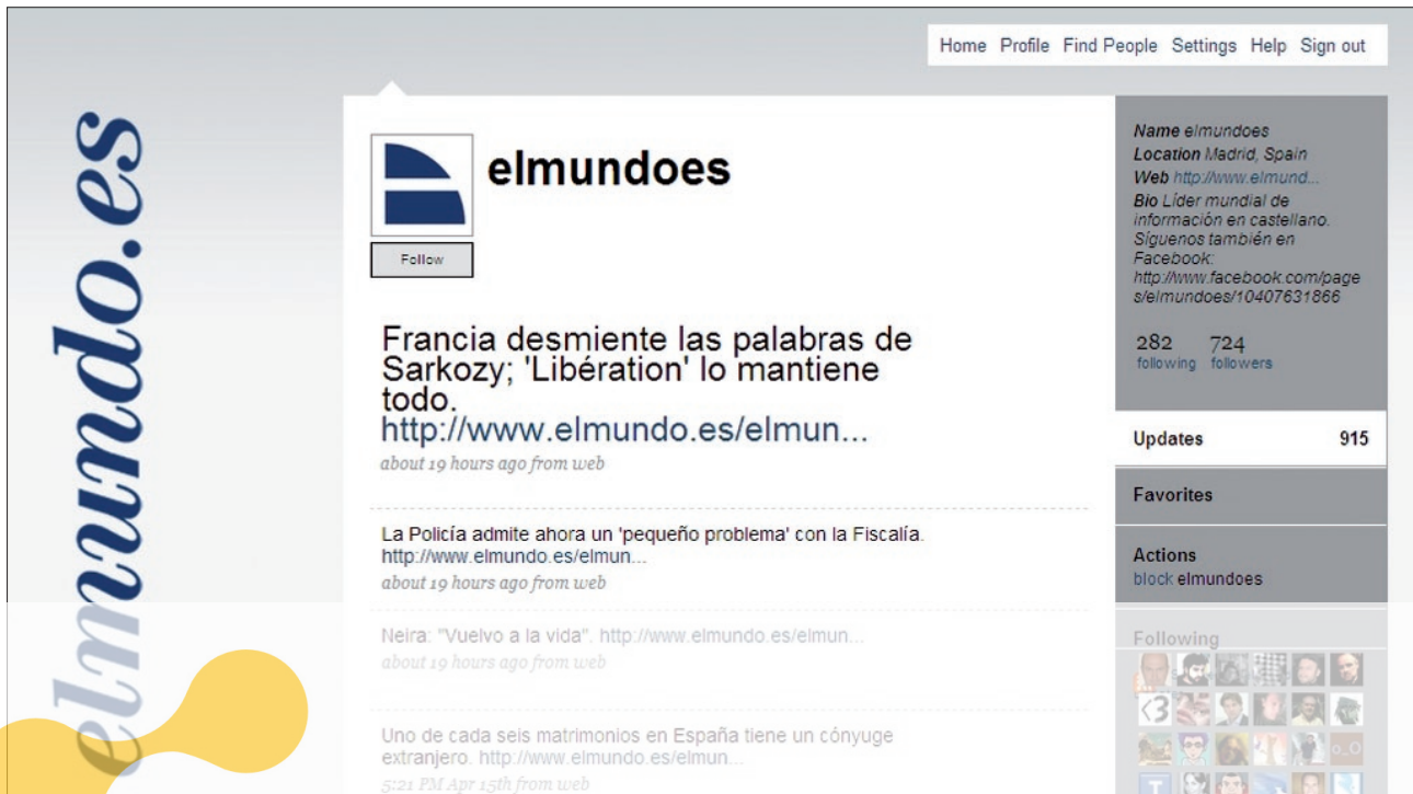
Canal en Twitter de El mundo.es