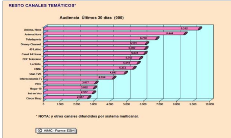
Tabla 1: Audiencia de los canales temáticos, según el Estudio General de Medios.

La selección de la muestra de conveniencia agrupó a todos los anunciantes considerados por Infoad dentro del sector «deportes y tiempo libre» que comprende 15 anunciantes de productos y servicios tradicionalmente considerados infantiles, como juguetes, centros de distribución de productos infantiles y parques de ocio, además de la autopromoción de otras cadenas de televisión. El total de anuncios analizados es de 184. Se ha elegido la cadena temática infantil Disney Channel porque Kantar Media la identificaba como líder de audiencia de la televisión en abierto durante el mes de noviembre de 2009 en España. El mes