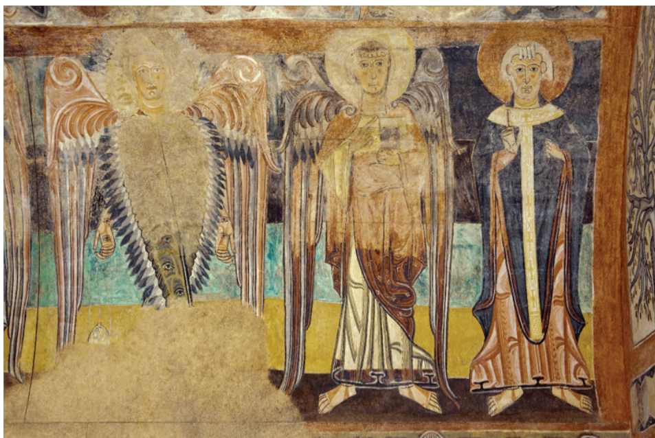
Fig. 1. Anónimo, Dos ángeles y un santo arzobispo , Ermita de la Vera Cruz, Maderuelo, Segovia. Madrid, Museo Nacional del Prado, 1948.

Esta imagen lineal de lo considerado sacro y solemne en la pintura de la Edad Media española se transfiere con pronunciada expresión simbólica en el auto sacramental La inmunidad del sagrado de Pedro Calderón escrito en la temprana edad moderna (1664) 28 . El conjunto de pinturas murales de la Ermita de Santa Cruz de Maderuelo se caracteriza por una cantidad excesiva de personajes, mientras que el auto de Calderón se define por un número proporcionado de caracterizaciones representativas de la temática eclesiástica. Se podría utilizar el mural completo de la ermita para realizar este estudio sobre La inmunidad del sagrado debido precisamente a su relevancia directa con esta temática; sin embargo, este trabajo se concentrará específicamente en el análisis de la simbología de alegorías representadas en la pintura del mural ( buon fresco ) de Dos ángeles y su respectiva convergencia y progresión artístico-teatral en el texto escrito del auto 29 . Las siguientes interrogantes delimitarán entonces el trayecto de este análisis: ¿en qué