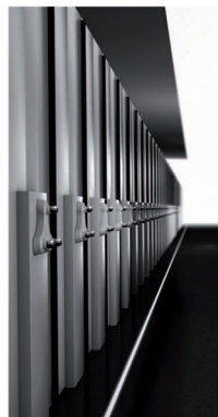
estanterías móviles EL ESPACIO EN MOVIMIENTO