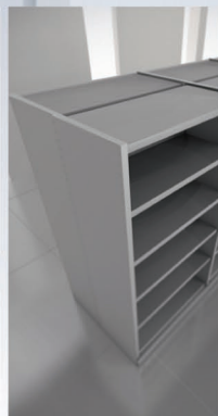
programa de bibliotecas EL ESPACIO MÁS INTELIGENTE

Río Tiber No. Desp. 501 Col. Cuauhtémoc, c.p. 06500 México, D.F. T.: 5208 8896 F.: 5514 2547 E.: comercial@eun.com.mx