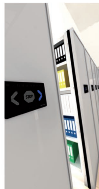
estanterías móviles con control electrónico LA TECNOLOGÍA APLICADA AL ESPACIO