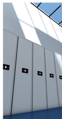
estanterías móviles motorizadas EL ESPACIO EN UN CLICK