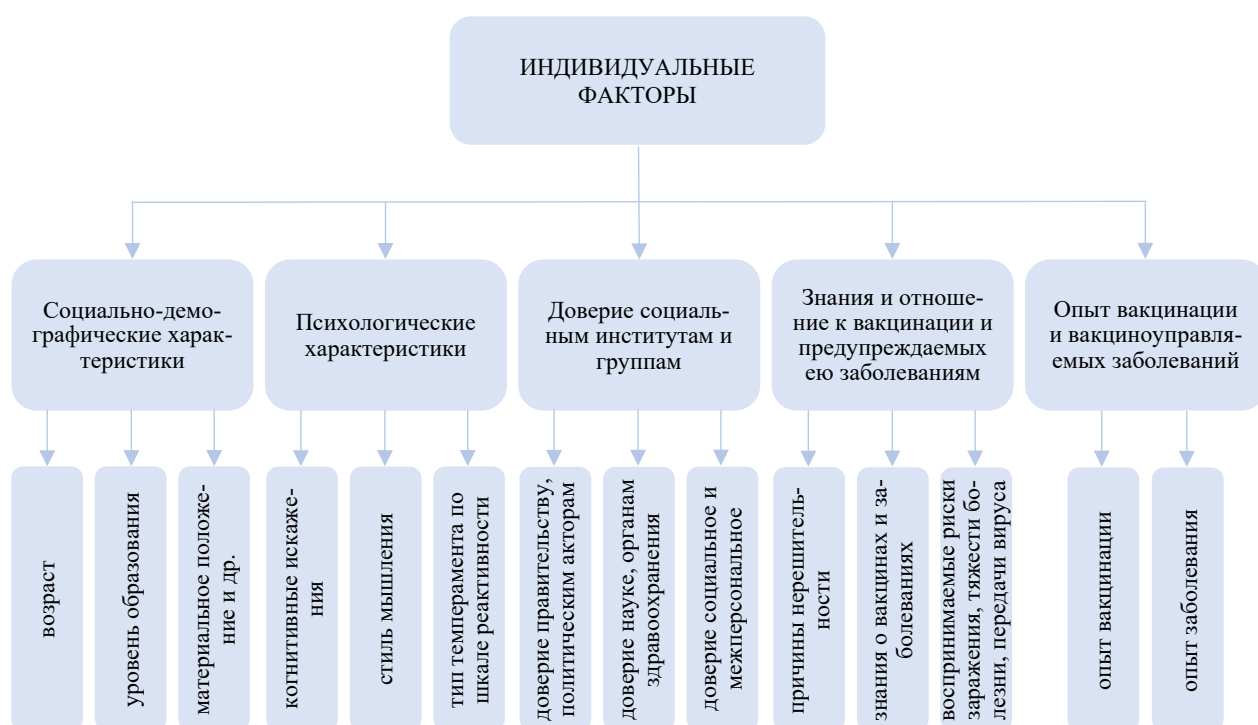
Рис. 2. Индивидуальные факторы поведения населения в отношении вакцинации

Результаты исследований показывают, что стратегии и тактики поведения в отношении вакцинации во многом зависят от социально-демографических и психологических характеристик индивидов, их доверия социальным институтам и группам, знаний и отношения к вакцинации и предупреждаемых ею заболеваниям, прошлого опыта, связанного с вакцинацией и вакциноуправляемыми заболеваниями. Эти детерминанты объединены нами в группу индивидуальных факторов вакцинации (рисунок 2).