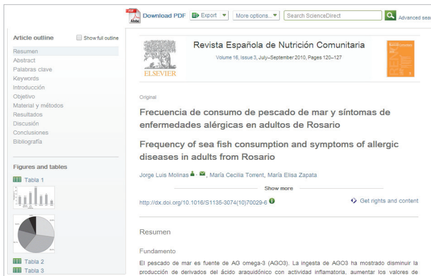
Artículo en Science Direct con visualización de figuras: http://www.sciencedirect.com/science/article/pii/S1135307410700296

En relación con las imágenes o fotografías, éstas pueden haber sido adquiridas a terceros. El hecho de que se incorporen a un artículo no significa que le afecten las mismas condiciones de copyright o copyleft . En cualquier caso, se trata de una información relevante que debe especificarse